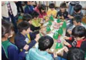
焼津市子ども会連合会

歳末たすけあい募金の歴史は古く、戦後混乱した社会経済状態の中で、戦災者、失業者、疾病等の状態にある方など、支援を必要とする人々が多く、その日常は非常に厳しい生活を余儀なくされていました。こうした状況の中、政府の提唱による「国民たすけあい運動」や全日本民生委員連盟の「歳末同情運動」、各地域で自然的に発生した「歳末同情品募集運動」などの動きが盛り上がり、昭和34年からは「歳末たすけあい募金」として現在まで実施されています。