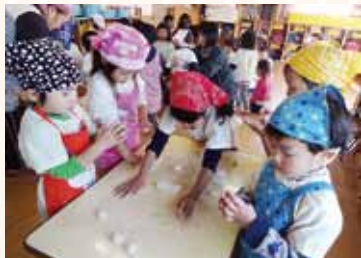
保育所すずらん焼津みなみ園

歳末たすけあい募金の歴史は古く、戦後混乱した社会経済状態の中で、戦災者、失業者、疾病等の状態にある方など、支援を必要とする人々が多く、その日常は非常に厳しい生活を余儀なくされていました。こうした状況の中、政府の提唱による「国民たすけあい運動」や全日本民生委員連盟の「歳末同情運動」、各地域で自然的に発生した「歳末同情品募集運動」などの動きが盛り上がり、昭和34年からは「歳末たすけあい募金」として現在まで実施されています。