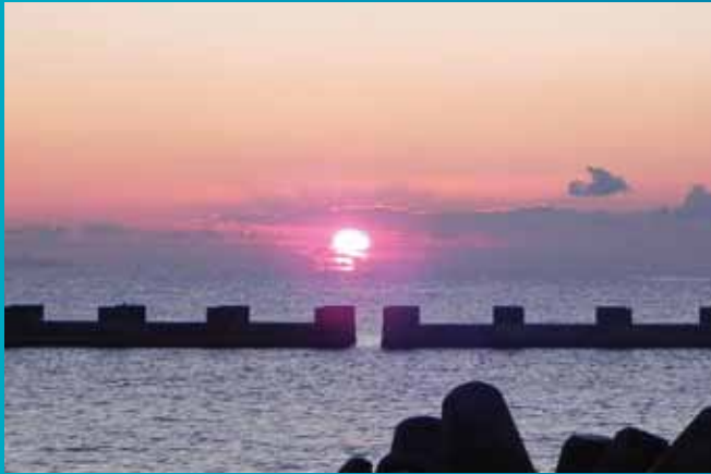
初日の出 (高新田浜にて)