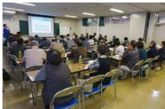
豊田公民館での開催の様子

この研修会が、地域で進める助けあい、支え合い活動のヒントになることを願っています。