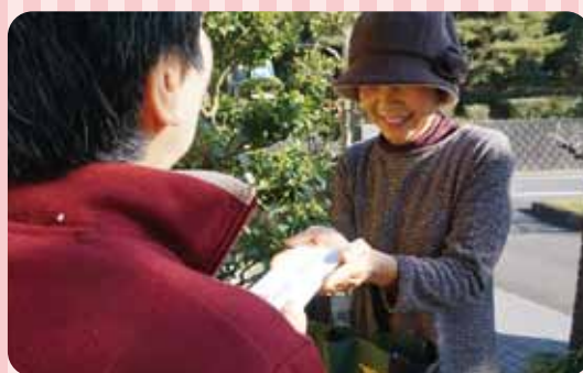
支援金をお手渡しする民生委員さん

募金運動にご協力いただきました皆さま、ご訪問くださった民生委員・児童委員の皆様ありがとうございました。