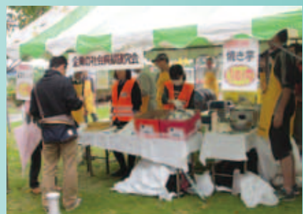
野良菜園で収穫したサツマイモを福祉まつり「ふれあい広場」にて、焼き芋や芋スティックにして販売する研究会メンバー