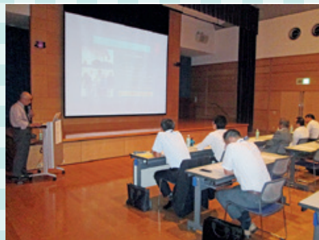
市内企業を招いての勉強会の様子