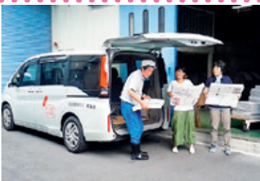
資材搬出・搬入での活用の様子

社会福祉法人高風会「漣」は、精神に障がいがある人たちに働く場を提供し、一般就労を目指せるよう支援している施設です。主に、企業からの請負で、組み立て作業、袋詰め作業、シール貼りなどの作業を行っています。この度、赤い羽根共同募金からの助成でワゴン車を購入させていただいたおかげで、より多くの仕事を受注できるようになり、利用者の工賃アップに貢献でき、大変喜んでおります。皆さまの心温まる募金に大変感謝します。ありがとうございました。