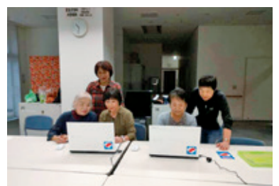
音訳作業での活用の様子

私たち・コンテは、視覚障害者の方へ「広報やいづ」を「声(CD)」で、毎月お届けする活動をしています。私たちと同じように、情報を必要としている視覚障害者の方々へ、少しでも「地域のか」となり、「声」でお役にたてるよう頑張っており日々活動をしています。この度、県共同募金会「赤い羽根」地域ふれあい支えあい助成により、速く・確実に音訳のCD化ができるパソコン2台を整備でき、ますます意欲的に活動することができました。今後も、更に多くの「声」による情報提供を必要とされる方のために活動を続けていきます。本当にありがとうございました。