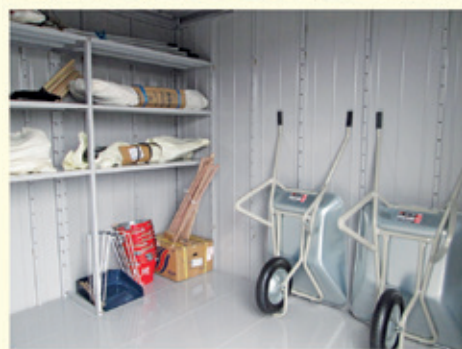
社会福祉法人春風寮に設置した備蓄倉庫