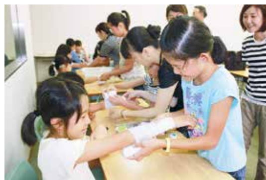
命の大切さ（看護学校）

8月1日から4日までの4日間、市内の小学生から一般の方を対象に、夏休みふくし体験「ふくしのススメ」を開催しました。地域の方を講師に点字、認知症、セラピー犬、命の大切さについて、体験学習を実施しました。各講座を通して、参加者のみなさんに、“ふくし”を楽しみながら学んでいただき、より身近なものとして感じていただくことができました。