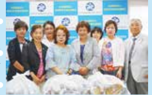
8月7日贈呈式の様子

アルミ缶、プル タブ、使用済み 切手、書き損じ はがきなどのご 寄付をいただき ました。