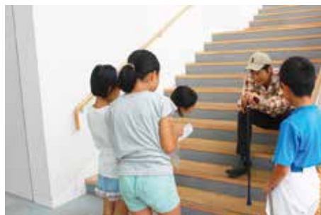
認知症ってなーに？