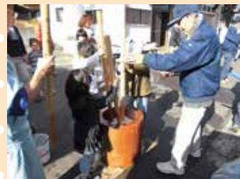
地域で行われたもちつき大会

今年も市民のみなさまから寄せられる「歳末たすけあい募金」を原資に助成事業を実施します。要綱及び申請書は、本所・大井川支所、又はホームページ（ブログコーナー）から取得できます。有効にご活用ください。