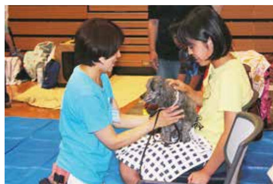
親子で学ぶセラピー犬