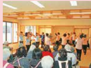
昨年度に助成した事業の一部です。