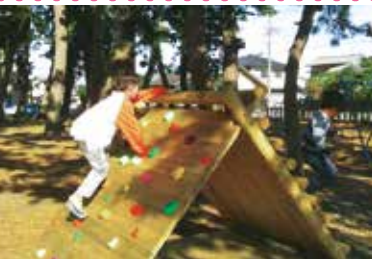
整備したボルダリング遊具

これまで遊具は基本遊具のみで、「もっと興味を持つ遊具を設置してほしい」との要望がでていたのですが予算の関係もあり、実現できていませんでした。このたび、共同募金の支援をいただき、ボルダリング遊具を整備することができました。