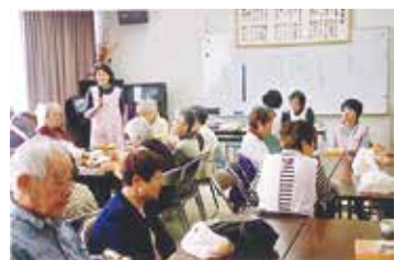
サロンでの活用の様子