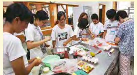
平成28年開催の様子