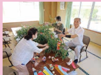
助成例：サロン活動で活用される、座椅子の整備。