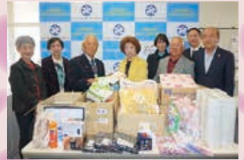
※撮影時のみマスクを外しています。

社会福祉活動資金寄附金、日用品等のご寄付をいただきました。有効に活用させていただきます。