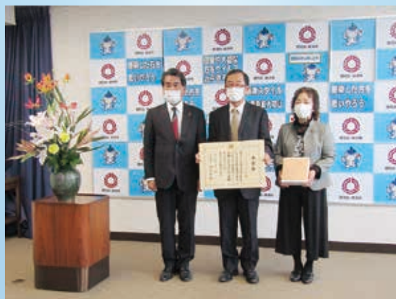
焼津市役所で行われた伝達式の様子 (R2.12.8)

“ほうたる”は焼津市内に暮らす、視覚障害を持つ方へ、社協やいづや大井川図書館新刊日より等を音訳してCDに録音し、お届けする活動を35年にわたり行ってきました。