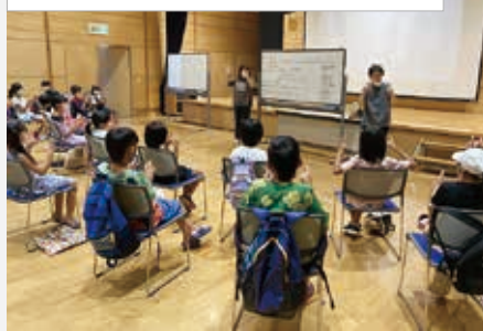
楽しく学ぶ！ふくしのススメ