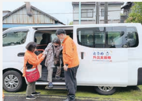
初日には6名の方を対象に、自宅とスーパー間の送迎をしました。

「地域ささえあい協議体」は、自治会、ボランティア、民生委員等の皆さんがメンバーとなり、誰もがいくつになっても住み慣れた地域で暮らせるよう、その地域の困りごとを調べ、どんな支えあい活動があると良いか話し合う場です。今回の「とうめ外出支援隊」も、この話し合いによってはじまりました。