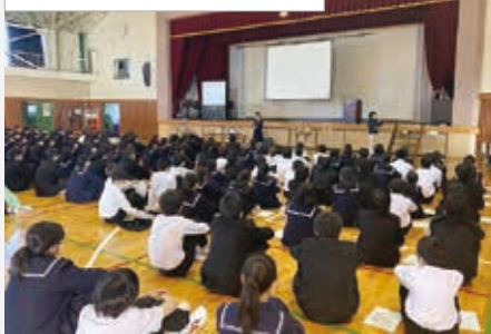
福祉教育実践校支援