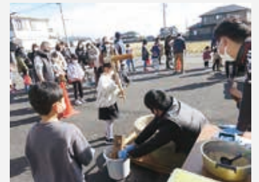
【地域交流餅つき大会】

今年も市民の皆さまから寄せられる「歳末たすけあい募金」を原資に、年末や新年に行う地域福祉活動に対し、助成金事業を実施します。要綱及び申請書は、本所・大井川支所、または社協ホームページから取得できます。有効にご活用ください。