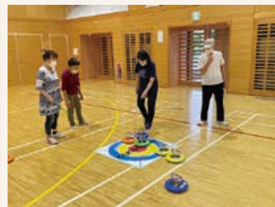
助成例：カラーリング用品の機器整備