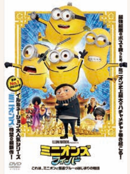
(C) 2022 Universal Studios. All Rights Reserved.

最強最悪のボスに仕えることが生きがいのミニオン。 彼らはなぜ、ひとりの少年グルーをボスに選んだのか？ そしてグルーはどのようにして月をも盗む大悪党になったのか？ すべては…1970年代の【グルー誘拐事件】から始まった！