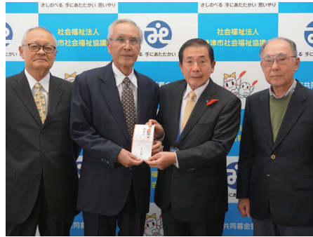
焼津青年会議所OBもも太郎様