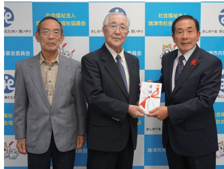
焼津市吟剣詩舞道連盟様